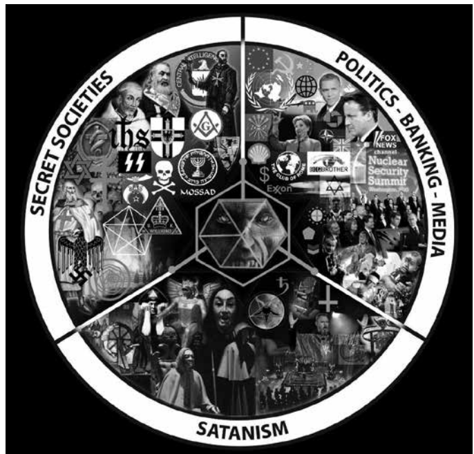
322. ábra: Az arkhonikus „hüllő-pók” van végső soron a sátánizmus, titkos társaságok és a fősodratú társadalmi intézmények mögött, ideértve a bankokat, a politikát és a média minden formáját.

Az emberiség a fény manifesztációja, ez a valódi teremtés. Amíg megosztod őket politikai pártok, borszín, bármi által, akkor – luciferi nézőpontból – megfosztod az ellenségedet a teljes képességétől. Nem tudnak kiállni magukért, mert ha megtennék, akkor a luciferiek vesztenének. Ez a szörny, ez a kapzsi szörny eltrünne.