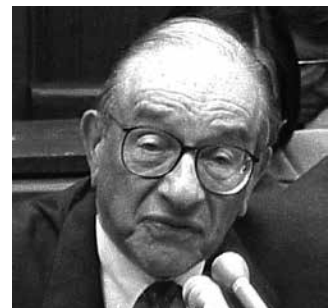
320. ábra: Alan Greenspan.

A cionista Alan Greenspan 1987-2006-ig vezette a Federal Reserve-öt Ronald Reagan, idősebbik George Bush, Bill Clinton és fiatalabbik George Bush elnöksége alatt (320. ábra). Nem az elnökök választották őt – a mestereik mondták nekik, hogy őt nevezzék ki. A sátáni hierarchia minden alkalommal a politikai hierarchia felett áll. Amikor Greenspan visszavonult a Fedtől, adtak neki egy tiszteletbeli pozíciót a brit kincstárnál vagy Öfelsége kincstáránál, hogy még pontosabbak legyünk. Az Emberi faj, emelkedj fel! (Human Race Get off Your Knees!) című könyvemben van egy dokumentum, melyet állítólag egy ausztráliai sátánista írt halála napjaiban, valamint e könyvemben