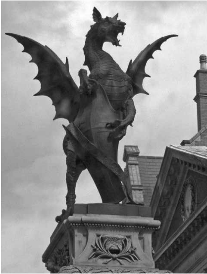
317. ábra: Repülő hüllő, ahol a City of London találkozik a templom negyeddal, amit a szomszédos Templomos Lovagok egyházzal neveztek el.

beszélgetőtársam levegő után kapkod, és markolja a mellkasát. Azt mondta, hogy nem beszélt arról az élményéről, hogy Heath alakot vált, mert azt gondolta, hogy ez még nekem is örültségnek hangzana. A nő ezután elmondta, hogy a rituálé alatt Heath hüllő-entitássá változott. Végül teljes testű hüllő lett, két lábnyit nőtt méretben – mondta. Az alakváltásban a méretnövekedés nagyon gyakori tulajdonság, és arra utal, hogy az egyik energia-információforrásról egy másikra váltanak, amiben más információkódok vannak. Azt mondta, hogy Heath enyhén pikkelyes volt, nagyrészt normálisan beszélt, bár olyan volt, mintha messziről beszélt volna (mint amikor régi telefonokkal beszéltem tengeren túlra), és a beszédében kis késés volt. Oly sokszor meséltek nekem ilyen történeteket, miközben az emberek és a média azt gondolja, hogy ezeket biztos kitalálom Nem. Ez tényleg megtörténik.