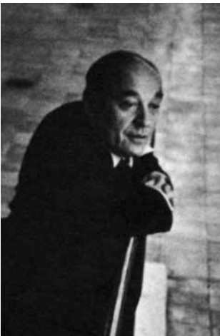
318. ábra: Baron Phillippe de Rothschild.