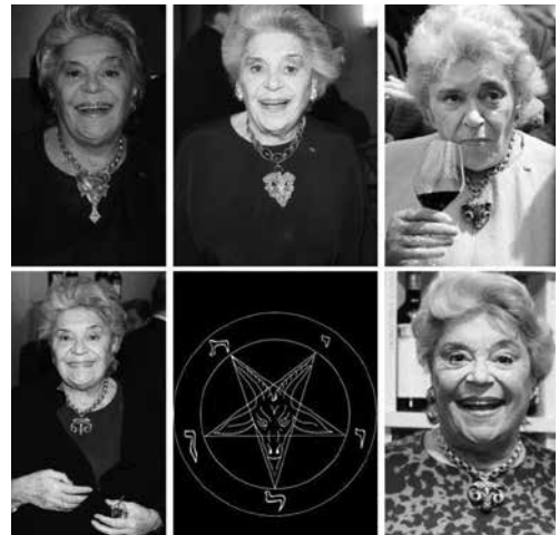
319. ábra: Baroness Philippine de Rothschild imádja a Baphomet (szaturnuszi) mellttüket.