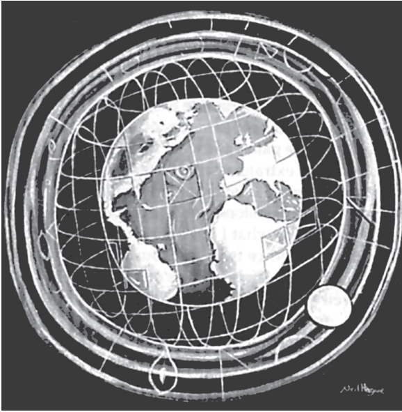
2. ábra: a Föld egy vibrációs börtön?

korlátozására, megosztásukra, a felettük való uralkodásra, mint létrehozni egy sor különleges földönkívüli trükkökön alapuló dogmatikus vallást? Nézd csak meg, mennyi fájdalmat, nyomort és generációk százain átörökített tudatlanságot hozott a világra a kereszténység, az iszlám, a judaizmus és az összes többi vallás. Ha ki akarod oltani valaki tudatosságát, hogy ne gondolkodjék többé a saját fejével, és el akarod vágni őt saját végtelen szellemi képességeitől, adj el neki egy dogmatikus vallást, vagy a merev dogma valami más formáját, majd nedves agyagként kedvedre formálhatod.