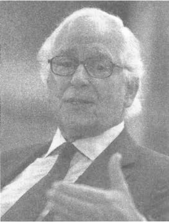
241. ábra: Sir Evelyn de Rothschild