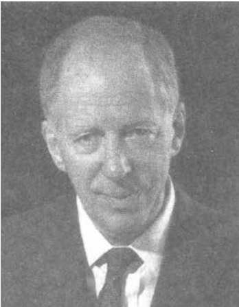
242. ábra: Jacob Rothschild