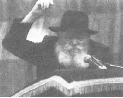
238. ábra: a Nagy Rebbe. Bájos pasas

is hivatalosan Palesztinához tartoznak, továbbá Libanont, Irakot, Szíriát, Egyiptomot és Jordániát, vagy ahogyan a Genézis mondja: „Egyiptom patakjától egészen a nagy folyamig, az Eufráteszig”. Ez a cionizmus nyilvános arca, ám valójában egy fő titkos társaság, rejtett irányító rendszerrel. A cionizmust a Rothschild-ház alapította és irányítja a mai napig. Arra törekedtek, hogy elhittessék: a cionizmus az összes zsidót felöleli, így antiszemitanak vagy rasszistának bélyegezhetnek mindenkit, aki terjeszti az igazságot a Rothschildokról és ügynökeikről a kormányokban, bankszektorban, az üzleti