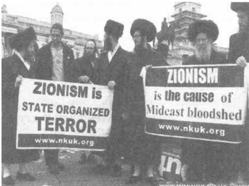
239. ábra: az a hiedelem, hogy a Rothschild-cionisták ugyanazok, mint a zsidó emberek – egy manipulált tévhit

Ezzel szemben nem minden zsidó cionista . Sokan ellenzik a cionizmust, és támogatják a palesztinokat a hadviselésben a Rothschild-cionista tulajdonú Egyesült Államok