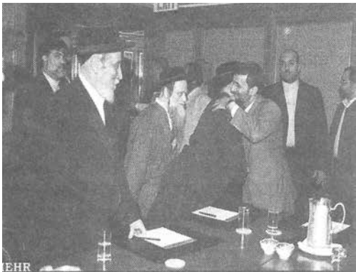
240. ábra: minden zsidó Rothschild-cionista?

pénzelte támadásokkal és népiirtással szemben. A zsidók tüntetéseket szerveznek, és bojkottra hívják fel az embereket Izraelben, válaszul a Rothschild-cionisták Palesztina elleni politikájára (239. ábra). De hány olyan ember tudja ezeket a dolgokat, akik a főáramlatú médiából gyűjtik információjukat? Hányan tudják – mint ahogy a 240. ábrán is látható –, hogy a vallásos zsidók irtóznak a Rothschild-cionisták követeléseitől, pl. hogy az USA támadja meg Iránt, ezzel szemben melegen üdvözlők az iráni miniszterelnököt Ahmadinezsádot, és biztosítják őt támogatásukról? Senki sem tudja, aki a Rothschild-cionisták által uralt főáramlatú médiákat figyeli. Hiszen ezek a médiák egyetlenegy vonalat sulykolnak: a cionizmus az összes zsidó embert jelenti. Történet vége. Aki kételkedik, olvassa el Norman Finkelstein, a káprázatos zsidó író munkáját, akinek a szülei a náci koncentrációs táborban szenvedtek; illetve a zsidó zenész és író Gilad Atzmon írásait a www.gilad.co.uk honlapon. A Rothschild-hálózatnak olyan szervezetei vannak, mint a B'nai B'rith és ennek oldalhajtásai, a Rágalmazásellenes Liga (Anti-Defamation League, ADL), mely együtt dolgozik más Rothschildok-irányította csoportokkal, hogy megcélazzák mindazokat,